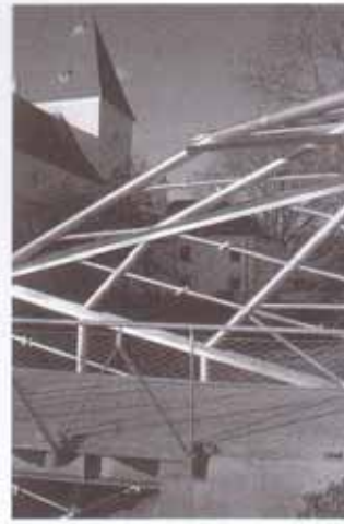
Les pièces (tubes et plats) de structure se soudées alors que les perforées d'enveloppe sont boulonnées.